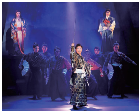
「梅雨將軍信長」のワンシーン

「ナゴヤ劇場ジャーナル」では発行をご支援いただけるサポート会員を募集しています。会費は年間6600円(税込)。会員には小紙を毎号お届けするほか、紙面に名前を掲載(希望者のみ)。会員の関係する公演、イベント情報を優先的に掲載させていただきます。【お申し込み、お問い合わせ】(株)マネージメント・プロ TEL 052(508)5095 郵便振替口座 00880-6-206130