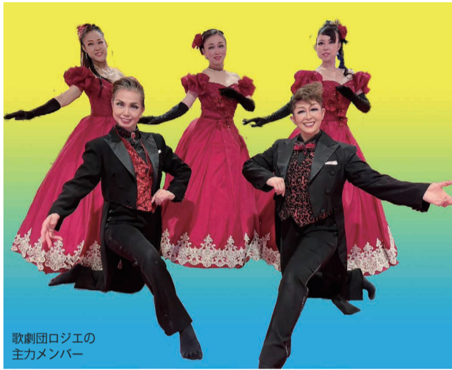
歌劇団ロジエの 主力メンバー