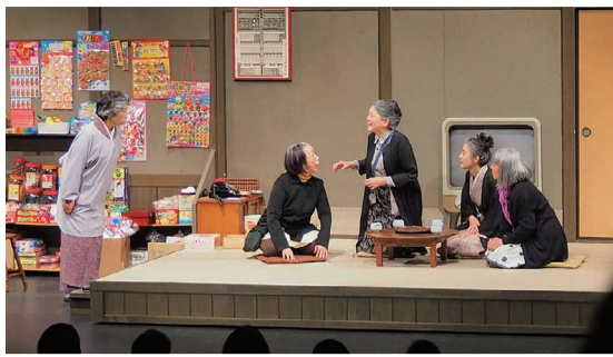
「やっとかめだなも」20年ぶりの再演