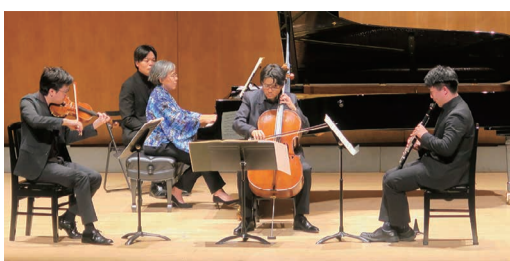
室内楽集団レーベイン ムジックの「フランス音楽の夕べ」(3月7日)