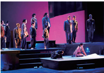
名古屋大空襲の一場面