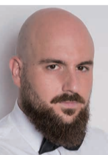
A・カッチャマーニ