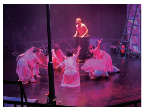
「炎八景ハナヒラチギリ」