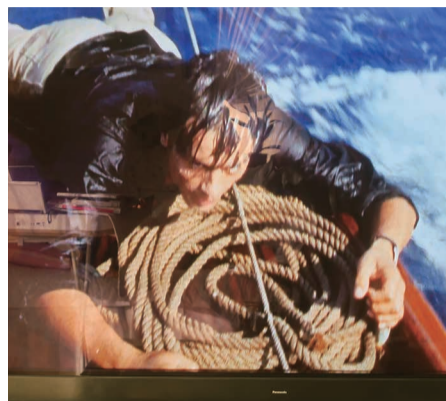
一躍スターになったアラソ・ドロン