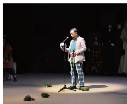
「鮭なら死んでるひよこたち」