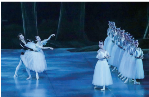
名作「ジゼル」のワンシーン

年12月10日・愛知県芸術劇場大ホール)で上演した「ジゼル」と「ソワレ・ド・バレエ」は興味に富む秀逸な舞台だった。純愛悲劇の「ジゼル」は同バレエ団の得意演目の一つ。演劇性にも優れているため感情移入しやすく、現実と幻想が交錯する上品なファンタジーが美しく息づく。