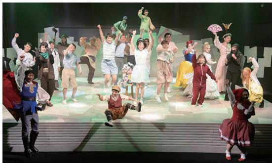
設立50周年を迎えた劇団うりんこ