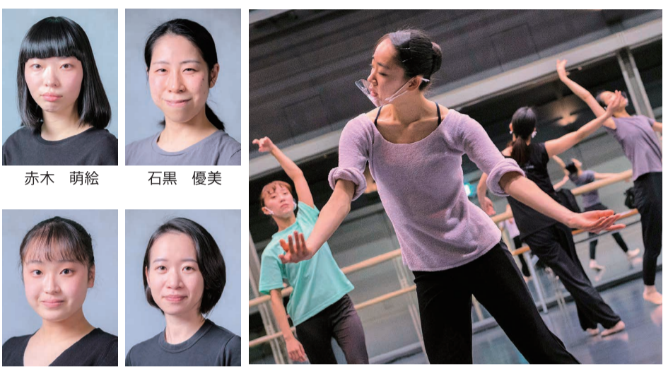
「風の又三郎」 稽古風景