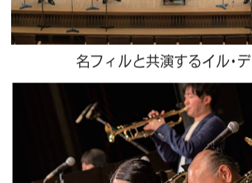
力強いアラスの魅力を全開