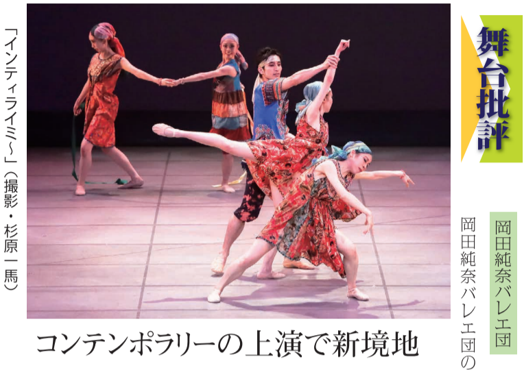
「インティライミ」