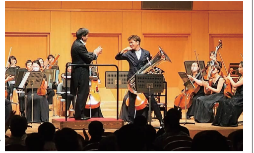
盛大な拍手を受ける杉山康人

「ペダリス ト」とは低音 楽器奏者の愛 称で、今回の 杉山はチェー バ奏者。20 03年にウ イーン国立歌 劇場管弦楽団 に入団（アジ ア人初）。05年 からは全米5 大オーケスト ラの一つ、ク リーヴランド管弦楽団に 入団、現在に至っている。