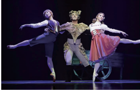
「フランダースの犬」