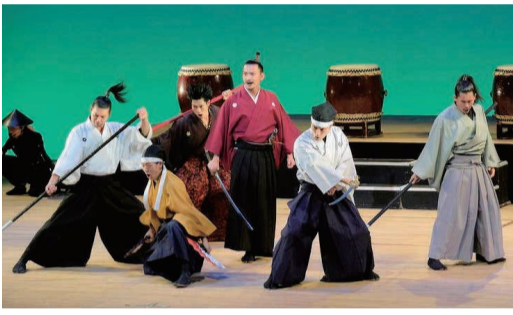
名古屋おもてなし武将隊の演舞