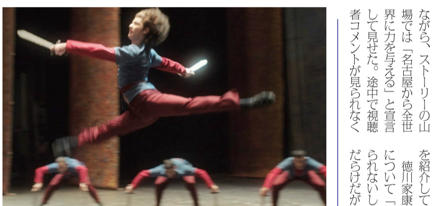
名曲「剣の舞」の制作秘話を描く 名演小劇場で映画「～我が心の旋律」公開中

活動を積極的に拡大した。ツイッターライブではメンバーが日替わりでクイズや講義を行う「毎日武将隊」を配信。他にも武将悩み相談や街の紹介などのコンテンツをソーシャル、ユーチューブなど、さまざまなプラットフォームを活用して発信していった。新メンバーのお披露目もツイッター生配信で行った。