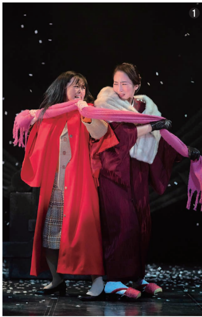
①「ゼロの焦点」(19・1・23)演出・木村繁 昭和文化小劇場。「なごや芝居の広場」第2弾。松本清張の壮大な世界を舞台化。能登金剛の最後の場面が忘れられない。小劇場5館で公演を行った。

名古屋の演劇人の環境は、決して良いとは言えず、そんな中でも、少しでも良い作品を奮闘している演劇人には頭が下がります。私が写真を撮ることで、少しでもそうした方のお役に立てばと撮り続けています。今回、そうした写真を多くの方に見て頂ける機会ができたのは、本当に嬉しいことです。