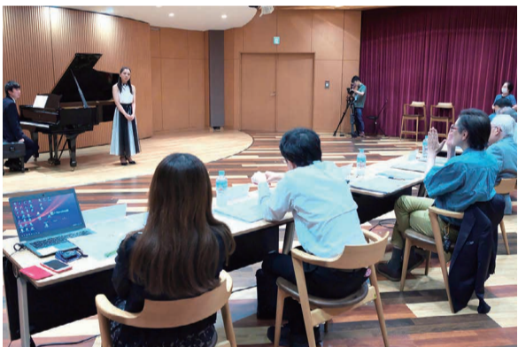
スター・クラシックス・アカデミア審査風景

若いクラシック演奏家を総合的に育てるプロジェクト「スター・クラシックス・アカデミア」の第一期合格者10人が決まり、7月から育成プログラムがスタートした。メニコンが主体となる。