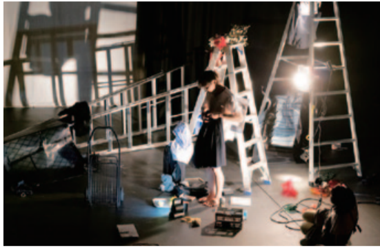
「サマースプリング」

県芸術劇場プロデュースで音の新たな表現に挑戦する「サウンドパフォーマンス・プラットフォーム」。今回は「音が描く時間」をテーマに公募3作、ゲスト2作品を上演した(同小ホール、2月23日)。