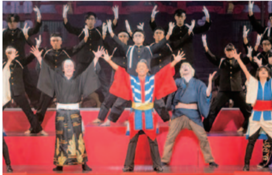
第72回名古屋をどり

舞台中央の大きな円を鍋に見立てた美術は簡潔だ。着ぐるみ風の衣装、ミラーボールの光で降雪を表現する。初めとなる真夏の公演。祝祭的な演出や「どまつり」勢の出演で、この季節に相応しい熱い興行と