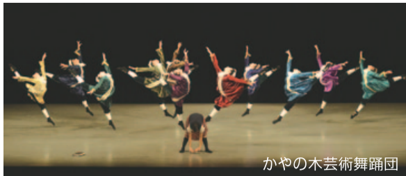
かやの木芸術舞踊団