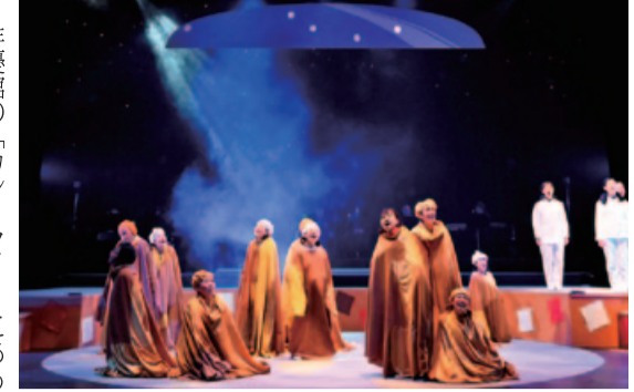
「カレーライス物語」

俳優館の「カレーライス物語」は、カレーの具材やスパイスが歌い踊って人間社会を風刺する異色