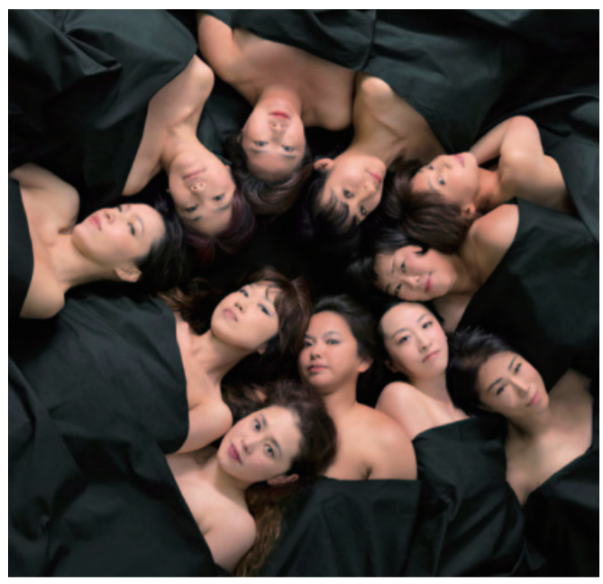
「渦の中の女たち」