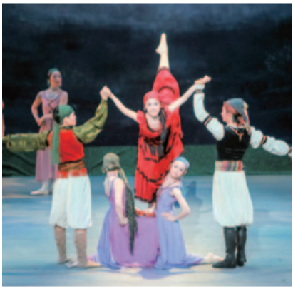
「二羽の鳩」