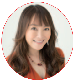
シンガー・井上あずみ

今回のテーマは「昭和」。メインイベントとなるのが、林家たい平の子ども向け落語会「らくごであそぼ」カンサー