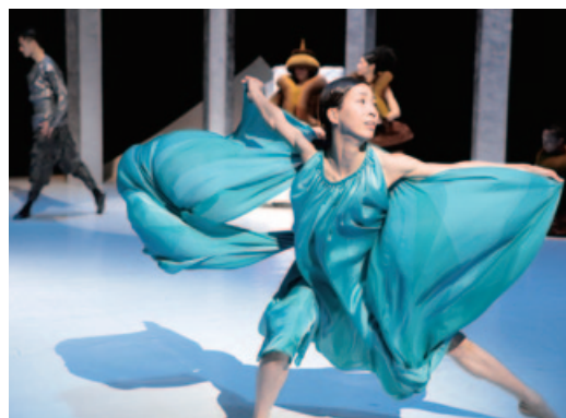
「ラ・バヤデー—幻の国」

新潟を拠点に全国、海外で活動を展開する舞踊団「Noism」(芸術監督・金森稜)が来名。7月16日(午後5時)芸文劇場大ホールで新作劇的舞踊「ラ・バヤデー」を上演する。