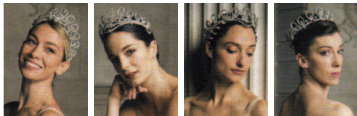
アバニャート アルピソン ジルペール エケ

エレオノラ・アバニャート、アマンディーヌ・アルピソンら、パリ・オペラ座バレエの最高峰エトワールが大挙来日。8月9日(午後6時30分)芸術劇場大ホールで「エトワール・ガラ2016」を開催する。