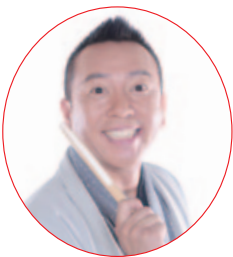
落語家・林家たい平