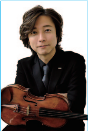
バイオリニスト大迫淳英

九州全土を巡る超人気のクルーズトレイン「ななつ星in九州」。雄大な自然と歴史に恵まれた食文化を堪能できるゴージャスな旅として人気を集めているが、列車内のラウンジではピアノトリオによる上質な生演奏を楽しむことができる。7月12日(午後7時)電気文化会館で催される