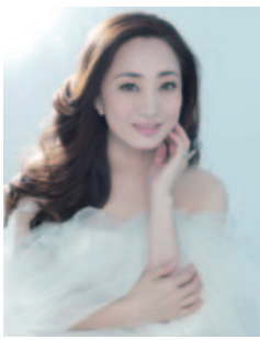
鈴木慶江 (ソプラノ)

東京藝大、同大学院修了。第29回イタリア声楽コンクール第1位・ミラノ大賞を獲得。第31回ベッリーニ国際音楽コンクールで最高位を受賞したオペラ歌手・鈴木慶江が、8月6日(午後6時30分)電気文化会館で「夏の夜の夢」オペラ・コンサートを開く。 2002年に発売したデビューアルバム「FIOR E」がクラシック界異例の大ヒット。