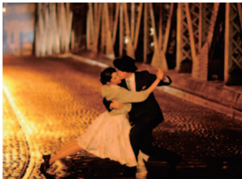
劇中の回想シーン

と女。普遍的なタンゴの魅力を存分に堪能させてくれるのが、ヘルマン・クラール監督の「ラスト・タンゴ」だ。 伝説のダンサー、マリア・ニエバス(撮影時80歳)、ファン・カルロス・コペス(同83歳)の出会いから今日までの数十年間が、二人の回想によってよみがえる。 出会いはブエノスアイレスのミンガロ(ライブハウス)だ。