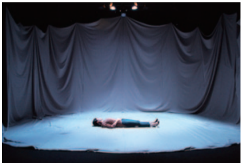
「だるい女」の冒頭シーン