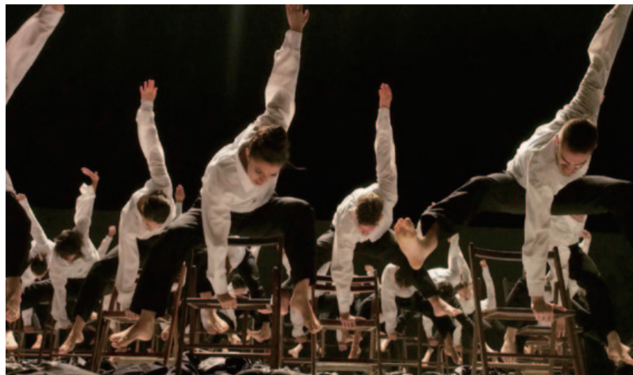
バットシェバ舞踊団「マイナス16」

愛知県芸術劇場ではイスラエルを代表する舞踊団「バットシェバ」を招き、10月7日(午後7時)同大ホールで「デカダンス」を上演する。 同団は、モダンダンスの巨匠マーサ・グラハムの活動を支援してきたバットシェバ・ド・ロスチャイルドが設立。1964年にグラハム作品で初公演を行った。90年からはグラハム舞踊団、ベジャール舞踊団で活躍したオハッド・ナハリンが芸術監督に就任。独自のコンテンポラリーを展開する舞踊団として、世界中のダンサー、愛好家から熱い注目を集めている。ナハリンの作品はパリ・オペラ座バレエ団、スペイン国立舞踊カンパニーなどの有名舞踊団で上演されている。今回上演される「デカ