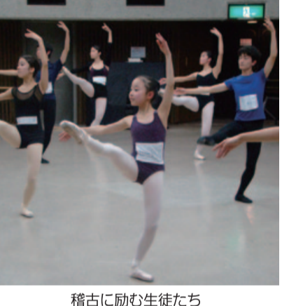
稽古に励む生徒たち

名古屋芸術創造センターが運営するバレエアカデミーが第2回の発表公演を行う。3月28日(午後7時)・29日(午後3時)同センター。