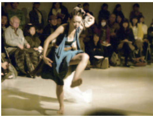
「アートな身体」