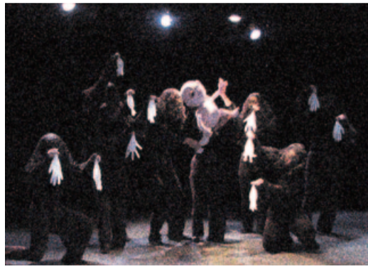
オブジェクト・パフォーマンス・シアター