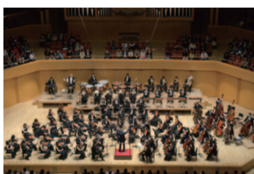
名フィル定期演奏会(12月)

名フィル定期演奏会(12月) 名フィル定演12月は3曲の「第一番」。指揮は尾高忠明。1曲目はモーツァルトの「交響曲第1番」。