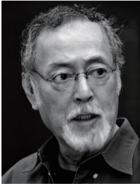
仲代達矢 (1932年生まれ)