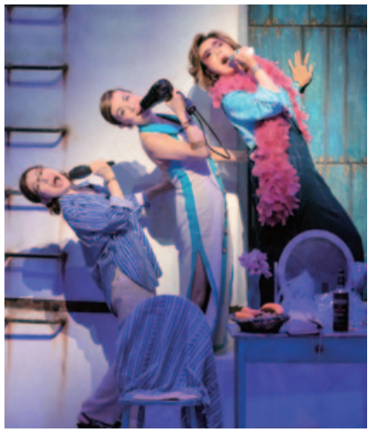
劇団四季「マンマ・ミーア!」

「マンマ・ミーア!」は、彼らのヒット曲で構成されたダンスミュージカルだ。主人公は、島のホテルの女主人ドナと、その娘が結婚を間近に控えたソフィ。だがソフィには大きな悩みがあった。それは自分の父親が誰だか分からないこと。そこでソフィは、自分の父親をさがすため、ある作戦を決行する。