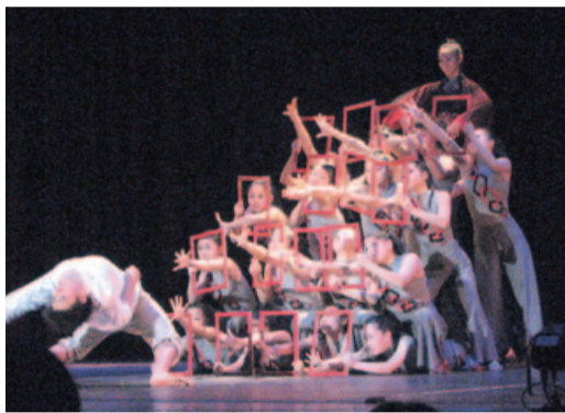
至学館高校ダンス部「刻印」